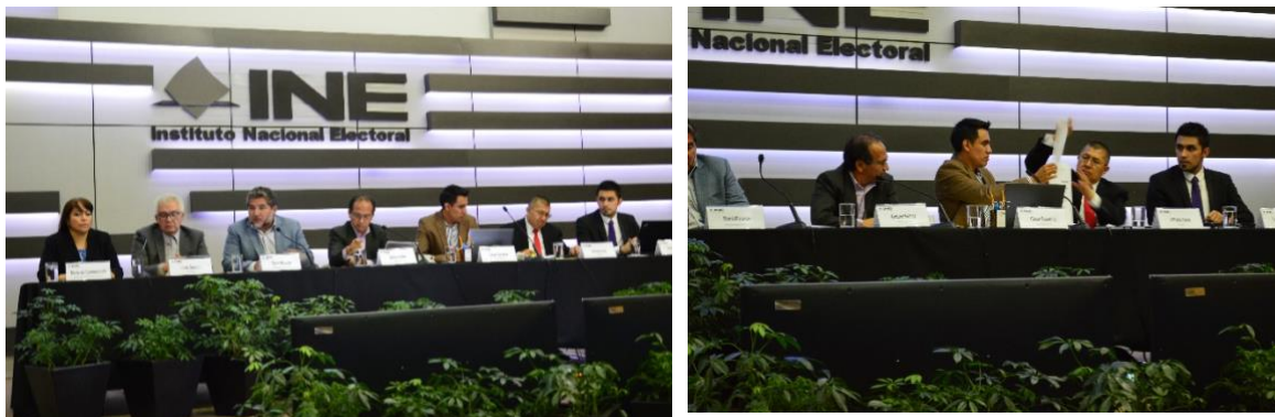
Figura 2. Evento de Selección de la Muestra para los Conteos Rápidos, 2019.