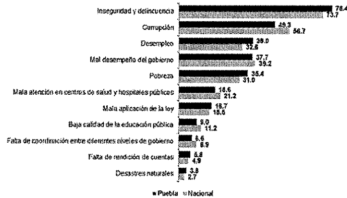
Percepción sobre problemas más importantes en su entidad federativa

26. Adicionalmente, este colegiado debe considerar que, según la Encuesta Intercensal 2015 de INEGI, más de 35% de la población en Puebla se considera a sí misma como indígena, alrededor de 11.2% habla una lengua indígena y 7% habla una lengua indígena y no habla español. La cifra total de parlantes de lenguas originarias es de 656,400, 73.0% de los cuales hablan náhuatl, 16.8% totonaco 2.9% mazateco, 2.6% popoloca, 1.6% otomí y 1.3% mixteco. Los municipios con mayor población indígena son los ubicados en la sierra norte de Puebla, al noreste de Tlaxcala, y los que colindan con Oaxaca en el sur. Puebla es la octava entidad con mayor porcentaje de población indígena.