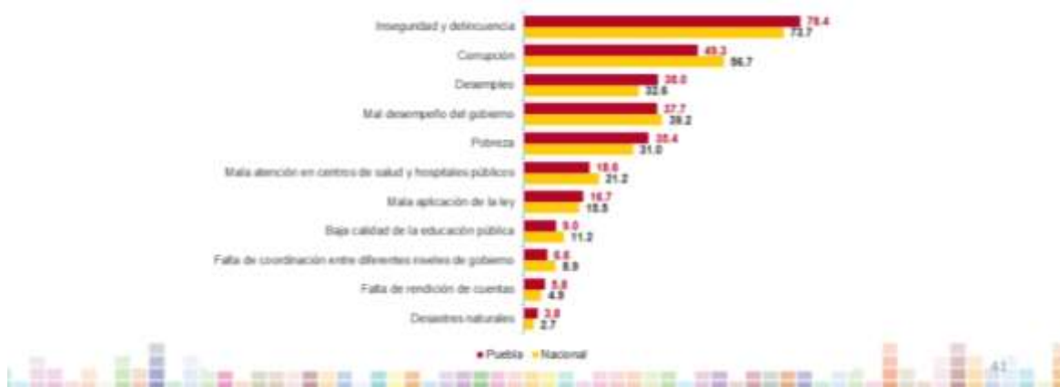
Percepción sobre problemas más importantes en su entidad federativa

En Puebla, 78.4% de la población de 18 años y más refirió que la inseguridad y delincuencia es el problema más importante que aqueja hoy en día su entidad federativa, seguido de la corrupción con 49.3% y el desempleo con 38%.